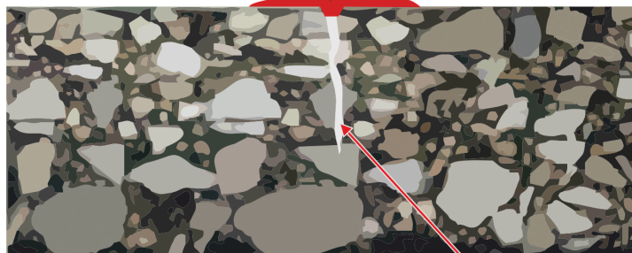
Schnitt durch den Asphalt